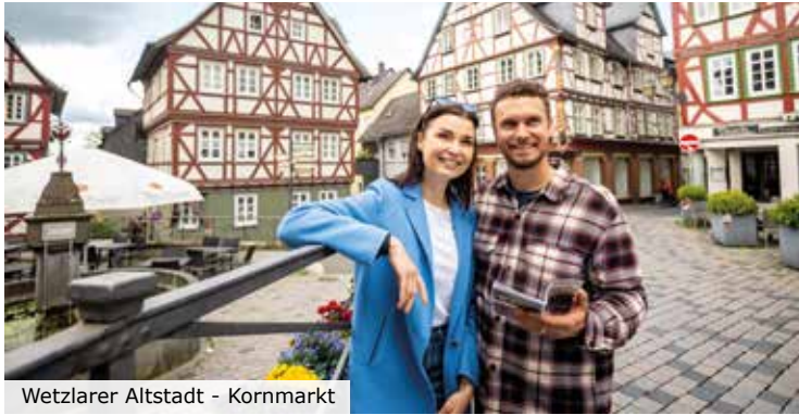
Wetzlarer Altstadt - Kornmarkt