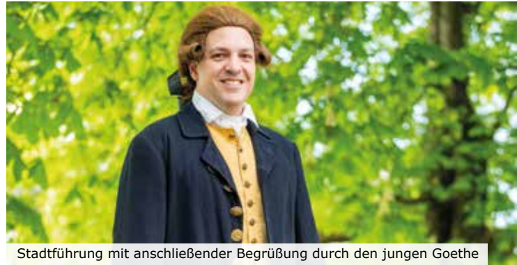
Stadtführung mit anschließender Begrüßung durch den jungen Goethe