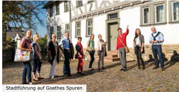
Stadtführung auf Goethes Spuren