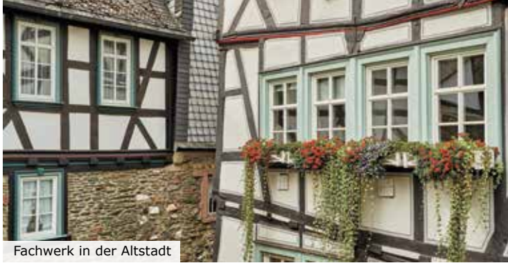
Fachwerk in der Altstadt