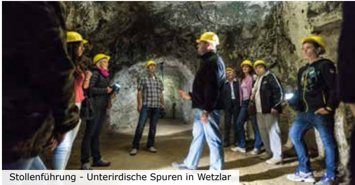
Stollenführung - Unterirdische Spuren in Wetzlar