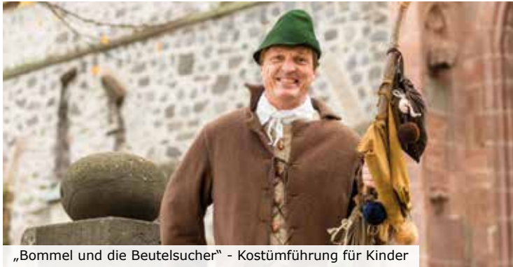
„Bommel und die Beutelsucher“ - Kostümführung für Kinder