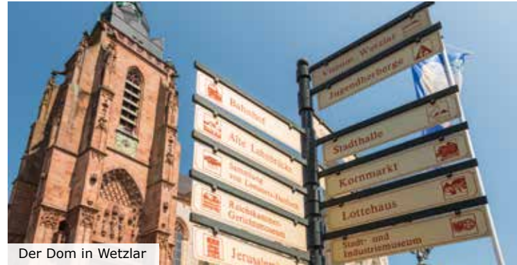
Der Dom in Wetzlar