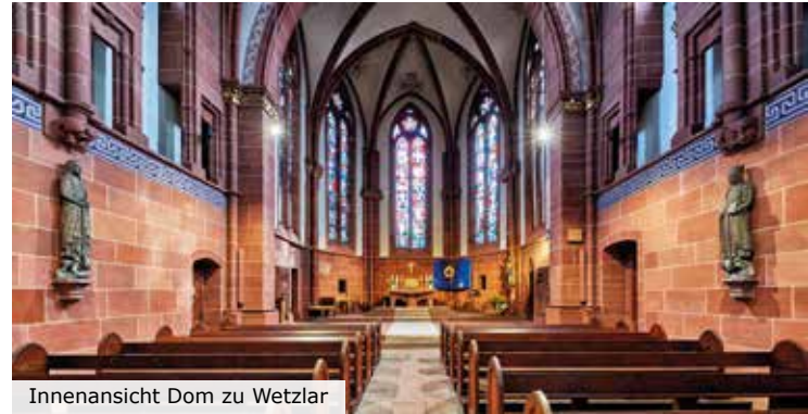
Innenansicht Dom zu Wetzlar