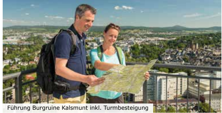
Führung Burgruine Kalsmunt inkl. Turmbesteigung