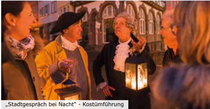
„Stadtgespräch bei Nacht“ - Kostümführung