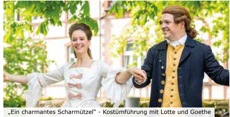
„Ein charmantes Scharmützel“ - Kostümführung mit Lotte und Goethe