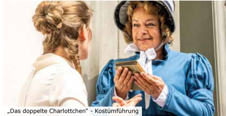
„Das doppelte Charlottchen“ - Kostümführung