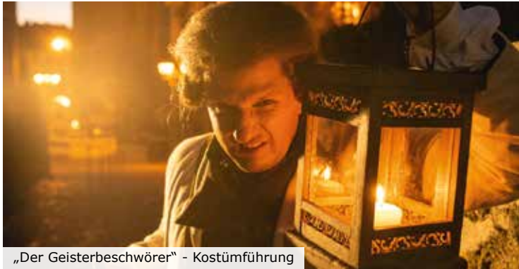
„Der Geisterbeschwörer“ - Kostümführung