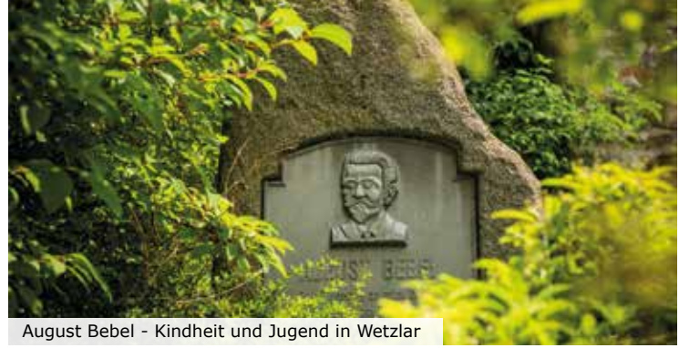
August Bebel - Kindheit und Jugend in Wetzlar