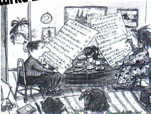
Der Elternkurs des Deutschen Kinderschutzbundes

Der Elternkurs des Deutschen Kinderschutzbundes wird in Wetzlar selbstverständlich regelmäßig durch den Kreisverband Lahn-Dill/Wetzlar angeboten.